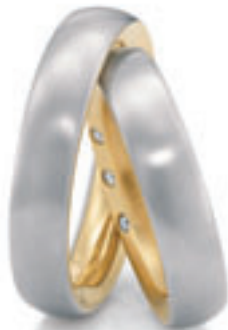
DESIGN CHRISTIAN BAUER

Jede Fassung hat ihre eigene Persönlichkeit und auch die individuellste und kühnste kann in Platin gefertigt werden.